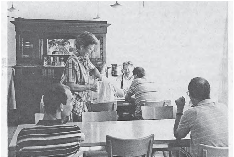
Das Angebot der Wochenend-Stube wird rege benutzt. Zur Zeit zählt das Gastgeberteam rund 40 Mitglieder. (September 1999)

sen, sein Areal an der Brahmsstrasse mit sozialen Wohnungen und anderen sozialen Einrichtungen zu überbauen. Über diesen Plan informierte er verschiedene soziale Institutionen und lud sie dazu ein, Ideen für eigene Projekte einzureichen, die in dieser Überbauung realisiert werden könnten. Das Projekt »Wochenend-Stube« kam an, und es wurde in die Pläne des »Brahmshofes« aufgenommen als Teil des vorgesehenen Cafés.