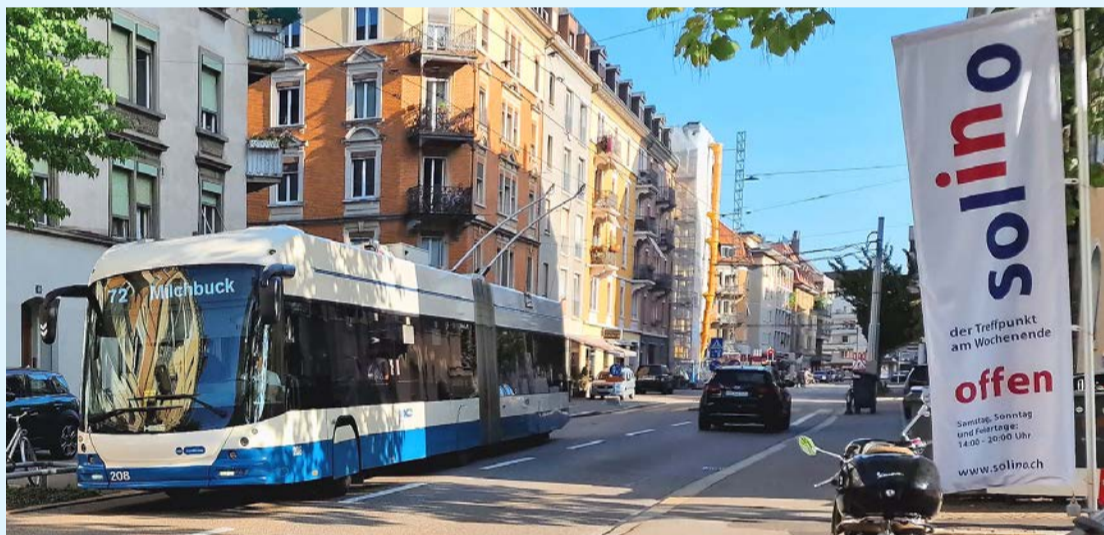
Im «solino», dem offenen Café, sind alle herzlich willkommen.